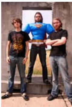
Dioramic 2009