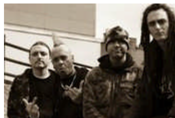
The Exploited