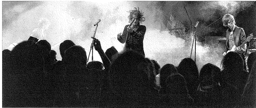
Festivalstimmung herrschte in den vergangenen Jahren vor der Rüt'n-Rock-Böhne.