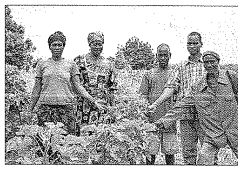
Biokraftstoff wird hier seit 2008 angebaut. Unterstützung kam vom Festival.

Das Line-up, also die Liste der auftretenden Bands, ist jedenfalls vielversprechend. Mit „Sepultura“ aus Brasilien, „Disco Ensemble“ aus Finnland, „Turbostaat“ aus Deutschland, „De Staat“ aus den Niederlanden oder „Egotic“ aus Deutschland sind Bands durchaus unterschiedlicher Stile vertreten. Headliner „Sepultura“ spricht am Freitag Fans harter Heavy-