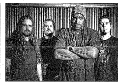
Heavy Metal vom Feinsten bieten Sepultura aus Brasilien.

Metal-Klänge an und ist mit elf Stadialben weltweit erfolgreich gewesen. Als Vorband von Madsen oder Linkin Park haben sie sich ein größeres Publikum erspielt. Insgesamt treten 16 Bands auf, sie werden in der nächsten Zeit im